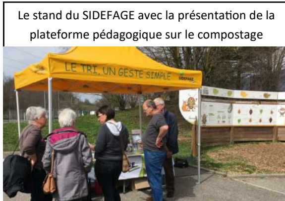
Le stand du SIDEFAGE avec la présentation de la plateforme pédagogique sur le compostage